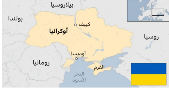
الشكل-2- خريطة توضح موقع اوكرانيا