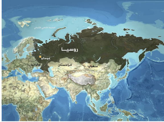
الشكل 1- خريطة تمثل موقع روسيا وقربها من اوكرانيا

عرقية احرى، تتحدث العديد من اللغات وتتبع تقاليد دينية وثقافية متباينة. يتركز معظم السكان الروس في الجزء الأوروبي من البلاد، خاصة في المنطقة الخصبة المحيطة بموسكو، العاصمة. تعد موسكو وسانت بطرسبرغ (لينينغراد سابقا) أهم مركزين ثقافيين وماليين في روسيا. على الرغم من أن المناخ يضيف طبقة من الصعوبة إلى الحياة اليومية، إلا أن الأرض مصدر سخي للمحاصيل والمواد، بما في ذلك الاحتياطيات الهائلة من النفط والغاز والمعادن الثمينة. بيد أن هذا الثراء في الموارد لم يترجم إلى حياة سهلة بالنسبة لمعظم سكان البلد 4 .