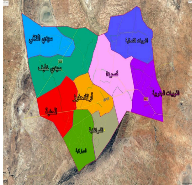
خريطة معتمدية أولاد حفوز